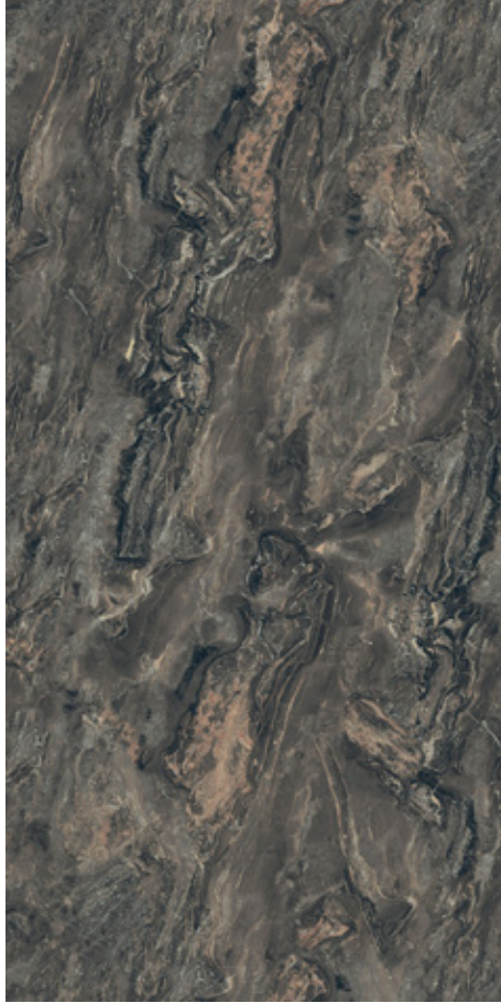
Versailles Mat Versailles Matte

T-ONE PORSELEN MUTFAK TEZGAHI T-ONE PORCELAIN KITCHEN COUNTERTOP